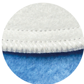
Overlocknaht - 5 Fäden